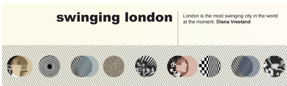
Rysunek 3. Strona tytułowa z motywami op-artowymi

Warto zaznaczyć, że wybór materiałów musiał być z konieczności ograniczony, żeby nie przytłoczyć słuchaczy ich nadmiarem, i każdemu z nich przypisano konkretny cel dydaktyczny. Wybór musiał także respektować prawa autorskie. W efekcie zastosowane materiały i techniki pracy z nimi pozwoliły na zachęcenie słuchaczy do zbudowania wizji tej epoki, a także do próby krytycznej refleksji nad jej dokonaniem.