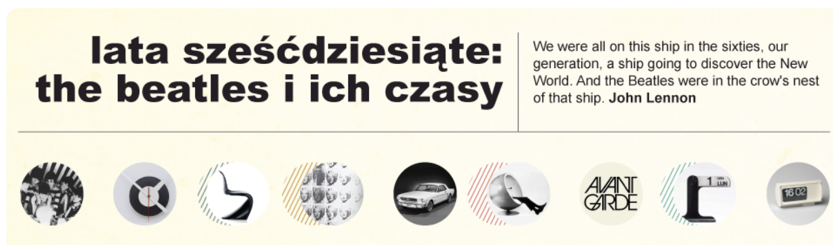
Rysunek 1. Fragment strony głównej kursu 5

modyfikacjom dla celów kursu. Materiały wideo w postaci wykładów na bazie prezentacji typu Powerpoint zostały nagrane i wyedytowane przy pomocy płatnego programu Camtasia Studio, natomiast pakiety SCORM zawierające różnorodne materiały dydaktyczne (tekst, pliki obrazkowe, materiały audio i wideo) powstały z wykorzystaniem rozpowszechnianego nieodpłatnie programu eXelearning. Materiały audio powstawały z wykorzystaniem popularnego programu Audacity, a materiały graficzne opracowane przez przydzielonego do kursu grafika powstały z wykorzystaniem Adobe Photoshop (Rys. 1). Zastosowano więc narzędzia standardowe i łatwo dostępne, które równocześnie dawały możliwość tworzenia różnorodnych materiałów dydaktycznych.