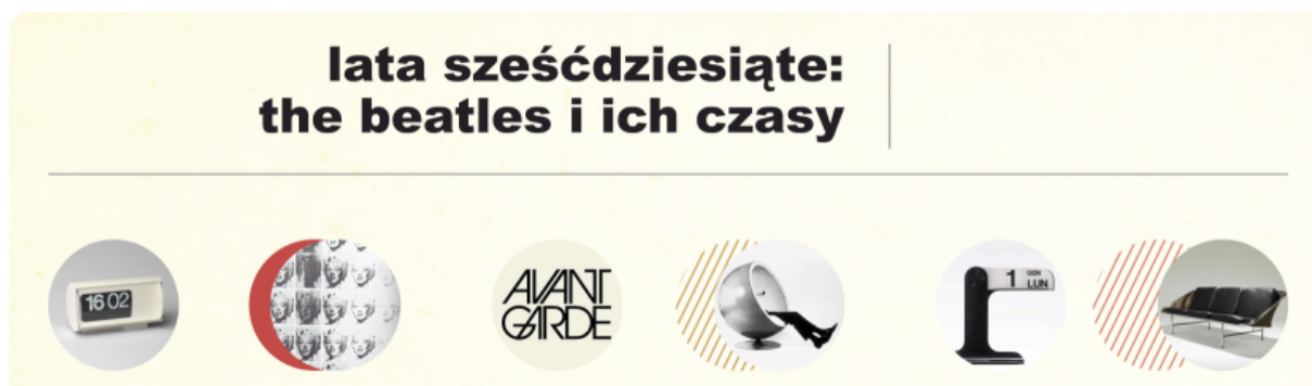
Rysunek 5. Fragment szablonu prezentacji multimedialnej.

Konsekwencją powyższych decyzji jest dopracowana, spójna i również w opinii studentów atrakcyjna szata wizualna, która współuczestniczy w budowaniu atmosfery kursowej i wizerunku epoki. Jest ona widoczna, ale nie przeszkadza w pracy, gdyż dołożono starań, by zachować zasady czytelności. Żaden z tych elementów nie jest niezbędny, żaden nie realizuje konkretnych celów dydaktycznych, ale trudno sobie wyobrazić, żeby e-learningowy kurs poświęcony historii kultury jakiejś epoki ograniczał się do mało atrakcyjnego wyglądu czystej strony platformy Moodle. Byłoby to trudnym do wytłumaczenia zubożeniem, niosącym ryzyko szybszego obniżenia motywacji poprzez samą monotonię w prezentacji materiałów. Warto podkreślić, że sami studenci w ewaluacji bardzo pozytywnie oceniają szatę graficzną, co wskazuje na to, że nie jest ona dla nich obojętna.