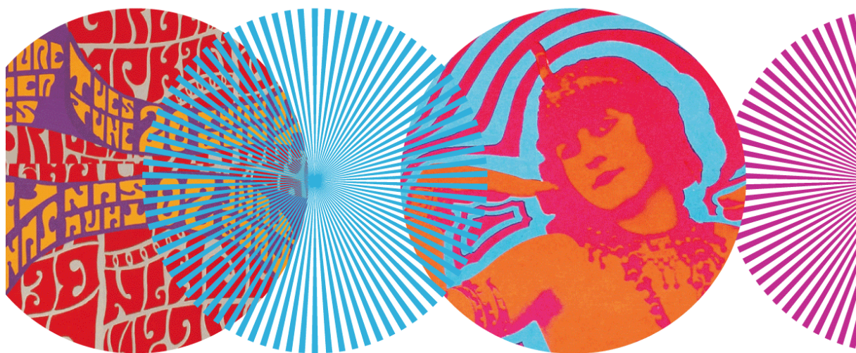
Rysunek 4. Fragment grafiki dla dokumentu tekstowego modułu o kontrkulturze

Wygląd strony głównej i wszystkich materiałów dydaktycznych zaprojektowano i wykonano specjalnie na potrzeby kursu, a wykonała go graficzka Magdalena Jędraszko. Inspiracją były style graficzne lat sześćdziesiątych z gazet, reklam i filmów. Nie chodziło o to, by naśladować, czy tworzyć replikę wyglądu magazynów ilustrowanych, ale żeby poprzez zastosowanie kilku prostych kodów wizualnych nadać kursowi jego indywidualny charakter. Za element przewodni obrano motyw kolorowych kół – niektóre jednobarwne, inne zawierają umieszczone wewnątrz wybrane projekty sztuki użytkowej lat sześćdziesiątych, z nazwą projektu i rokiem powstania (Rys. 4). Zgeometryzowane formy, właściwe dla designu epoki z przykładami tego designu miały w zamysle poprzez swoją różnorodność pokazać, jak bogate było wzornictwo przemysłowe i jak wiele z tych projektów wciąż jest w produkcji i może uchodzić za nowoczesne. Design stał się zatem uniwersalnym językiem, którym lata sześćdziesiąte mogły przemawiać do dzisiejszego odbiorcy. Przy tematach związanych z zespołem The Beatles w kołach zamieszczono natomiast wizerunki członków zespołu zainspirowane oryginalnymi okładkami albumów długogrających.